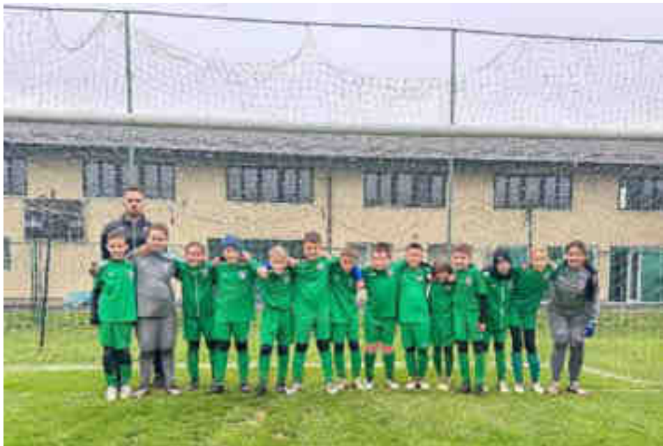
Momčad početnika NK Ban Jelačić – jesenji prvaci u „LIGI POČETNIKA C!“