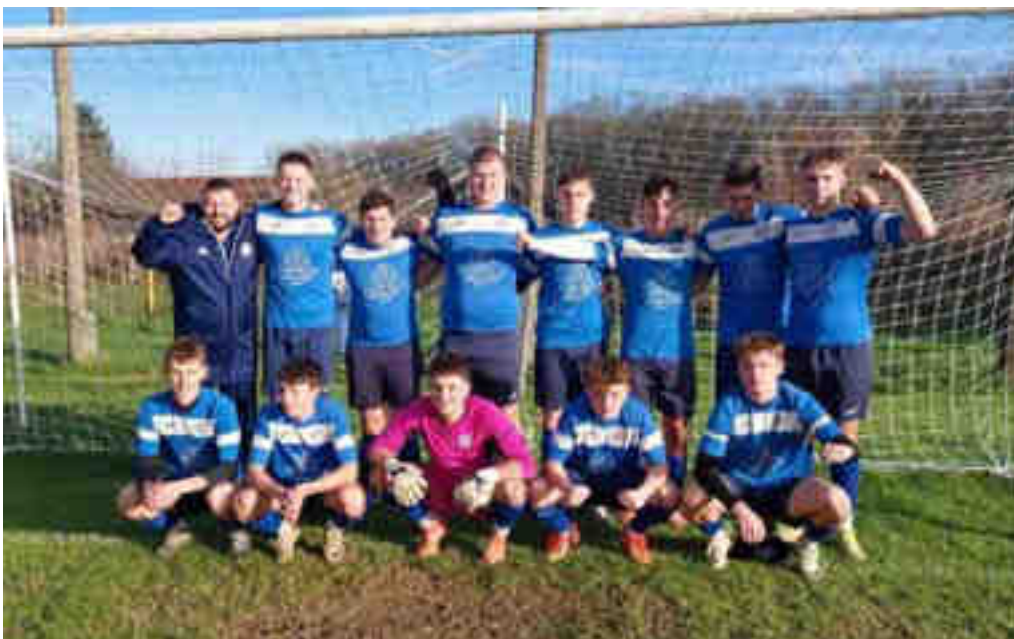
Momčad juniora NK Rakovec – jesenji prvaci „LIGE JUNIORA B“