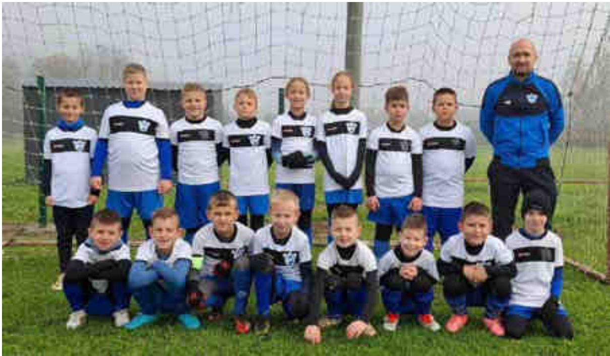
Momčad prstića NK Polet – jesenji prvaci u „LIGI PRSTIĆA A“