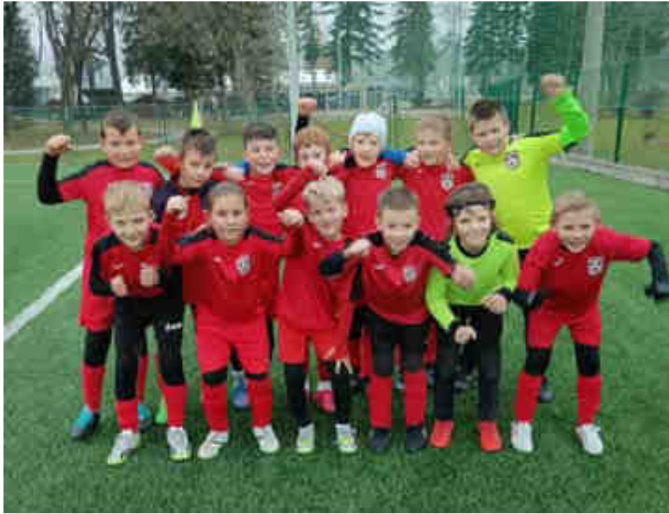
Momčad početnika NK Zelina – jesenji prvaci u „LIGI POČETNIKA B“