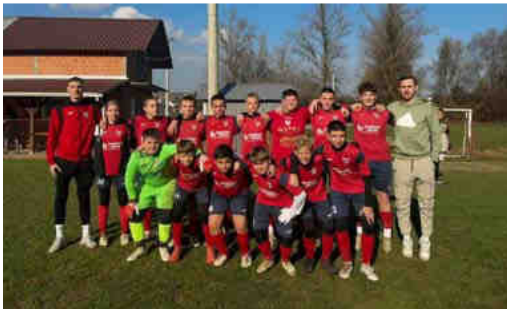
Momčad pionira NK Croatia – jesenji prvaci „LIGE PIONIRA“