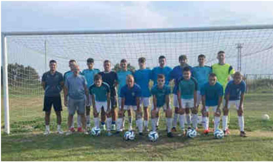
Momčad juniora NK Kloštar – jesenji prvaci – „LIGE JUNIORA A“