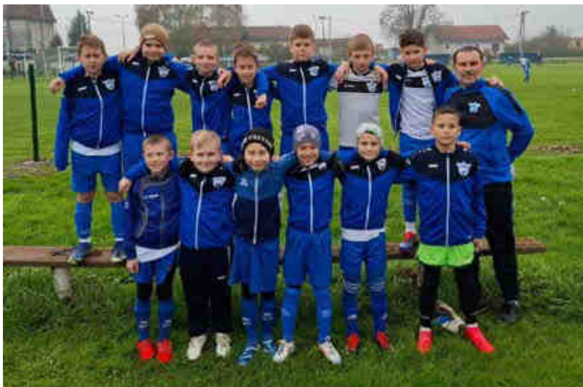
Momčad početnika NK Polet – jesenji prvaci u „LIGI POČETNIKA A“