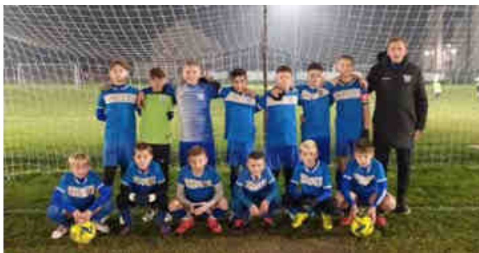
Momčad mlađih pionira NK Polet – jesenji prvaci „LIGE MLAĐI PIONIRI“