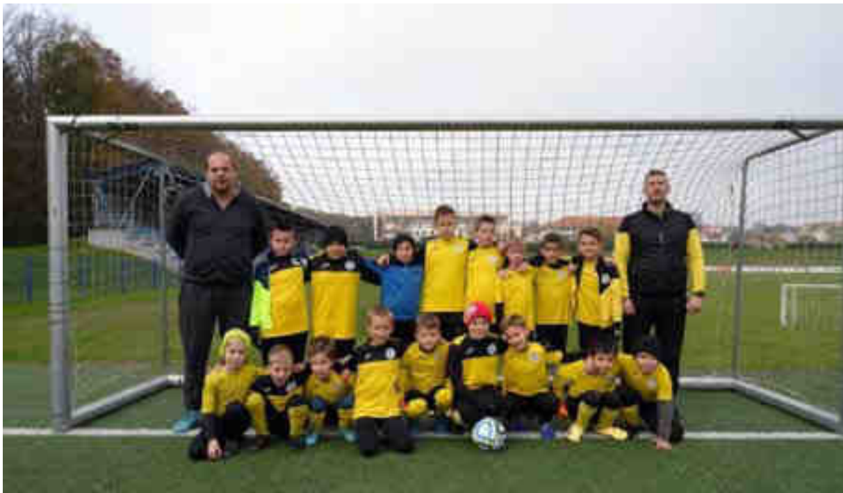
Momčad prstića NK Klas – jesenji prvaci u „LIGI PRSTIĆA B“